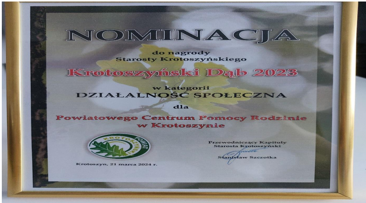
Dyplom nominacji do Tytułu KROTOSZYŃSKI DĄB 2023